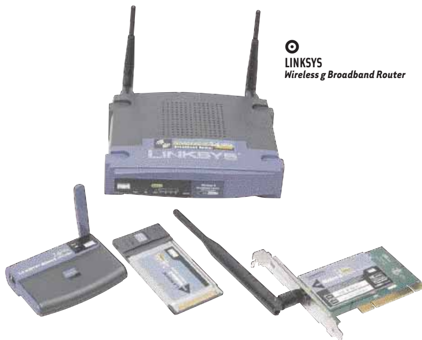
LINKSYS Wireless G Broadband Router

Een eigen netwerk, dat betekent alle computers in huis verbinden en ze de randapparatuur en internetverbinding laten delen. Dankzij het draadloze Wi-Fi netwerk surft u met een draagbare computer zelfs waar u wilt. Klinkt aanlokkelijk. Maar het is niet altijd makkelijk doenbaar, noch overal geschikt.