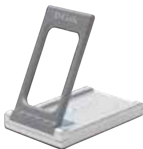
De USB-sleutel heeft bepaalde voordelen voor PCI en PCCards: hij kan worden meegenomen, is zowel met draagbare als met desktopcomputers te gebruiken en sommige hebben zelfs een kleine draaibare antenne.

Als uw netwerk tot buiten uw muren reikt, merkt uw buurman daar niets van als hij geen Wi-Fi-uitrusting heeft. Heeft hij die wel, dan kan hij van uw netwerk meegenieten en eventueel in uw bestanden neuzen. Zelfs als hij geen slechte bedoelingen heeft, zullen beide netwerken elkaar overlappen en kunt u problemen ondervinden, bijvoorbeeld